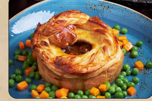
ГИННЕСС ПАЙ / GUINNESS PIE → 890 P