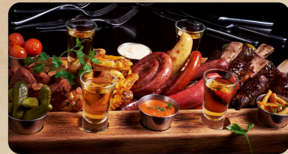
АССОРТИ "CROSS KEYS" / MIX "CROSS KEYS" Говяжий ребра, ассорти колбасок, свиные ребра Ред Девил, крылья Баффало, подается с ассорти солений и соусами / Beef ribs, assorted sausages, pork ribs Red Devil, buffalo wings, served with assorted pickles and sauces → 5600 P