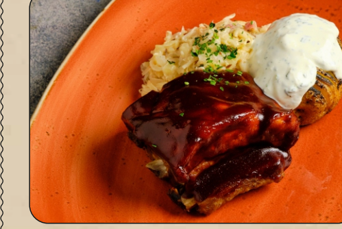
СВИНЫЕ РЕБРА BBQ / BBQ PORK RIBS → 1250 P