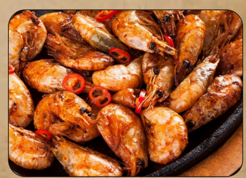
ЖАРЕНЫЕ ПИВНЫЕ КРЕВЕТКИ КИМЧИ / FRIED BEER SHRIMPS KIMCHI → 1490 P