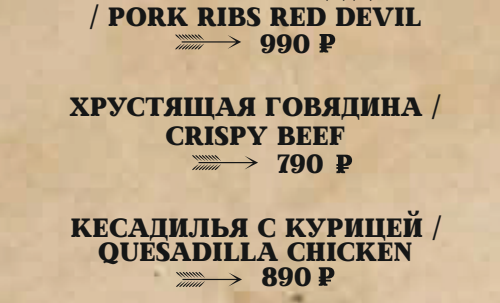
СВИНЫЕ РЕБРА РЕД ДЕВИЛ / PORK RIBS RED DEVIL → 990 P