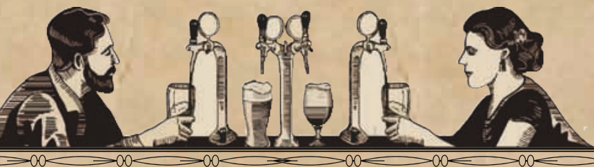
БАЛАНТАЙН СТАУТ / BALLANTAIN STOUT 0.25/0.5 310/590 P