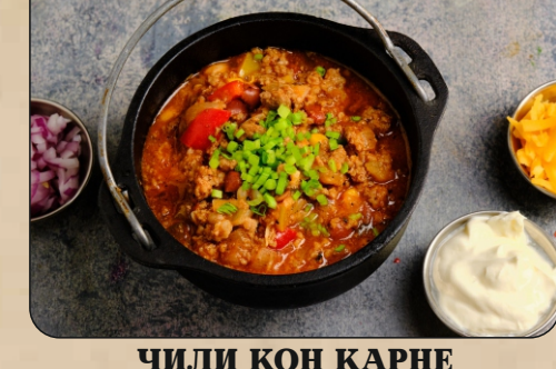
ЧИЛИ КОН КАРНЕ / CHILI CON CARNE → 990 P