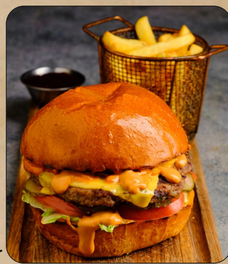
CROSS KEYS БУРГЕР / CROSS KEYS BURGER → 1100 P