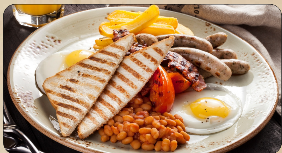
АНГЛИЙСКИЙ ЗАВТРАК / ENGLISH BREAKFAST Вендик, грибы, фасоль и помидоры, колбаски, картофель, яйца, жареный бекон, хрустящие тосты Fried eggs, fried mushrooms, beans in tomato sauce, sausages, french fries, crispy bacon, toasts → 1100 P