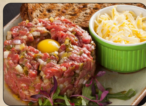
ТАР-ТАР ИЗ ГОВЯДИНЫ / BEEF TARTAR → 1100 P