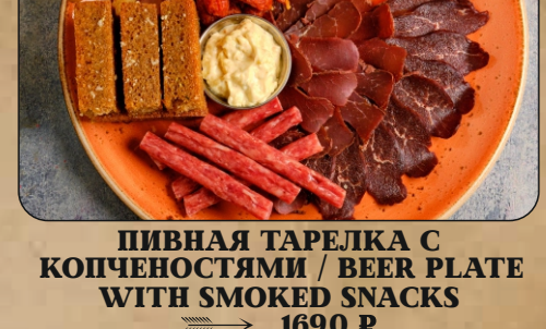
ПИВНАЯ ТАРЕЛКА С КОПЧЕНОСТЯМИ / BEER PLATE WITH SMOKED SNACKS → 1690 P