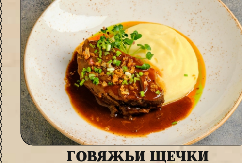
ГОВЯЖЬИ ШЕЧКИ С КАРТОФЕЛЬНЫМ ПОРЕ / CHEEKS WITH MASHED POTATOES → 1100 P