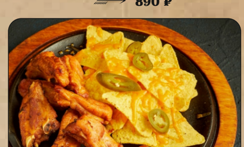
КРЫЛЬЯ БАФФАЛО / BUFFALO CHICKEN WINGS → 890 P