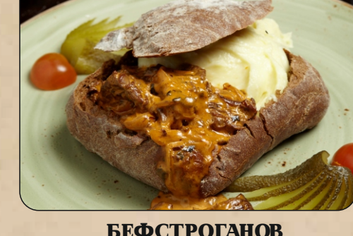
БЕФ СТРОГАНОВ / BEEF STROGANOFF → 1250 P