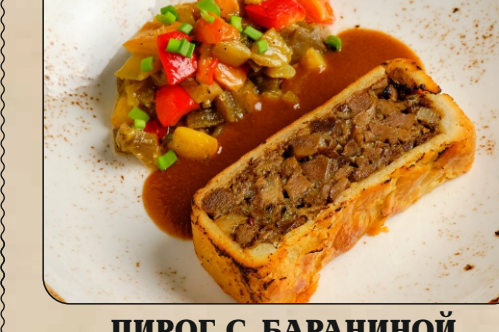
ПИРОГ С БАРАНИНОЙ / LAMB PIE WITH BAKED VEGETABLES → 1100 P