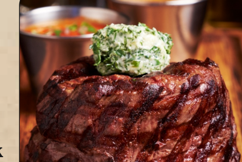
СТРИПЛОИН / STRIPLOIN → 3500 P