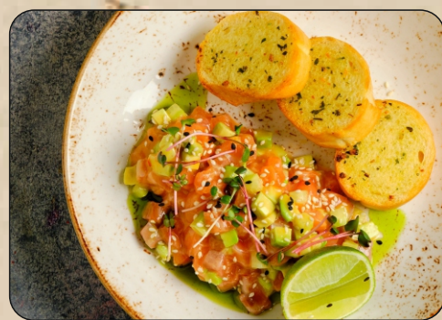
ТАР-ТАР ИЗ ЛОСОСЯ / SALMON TARTAR → 1100 P