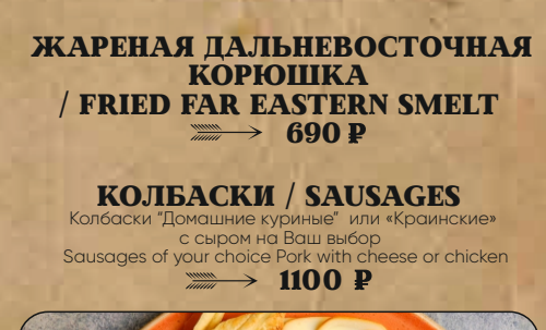
ЖАРЕНАЯ ДАЛЬНЕВОСТОЧНАЯ КОРОШКА / FRIED FAR EASTERN SMELT → 690 P