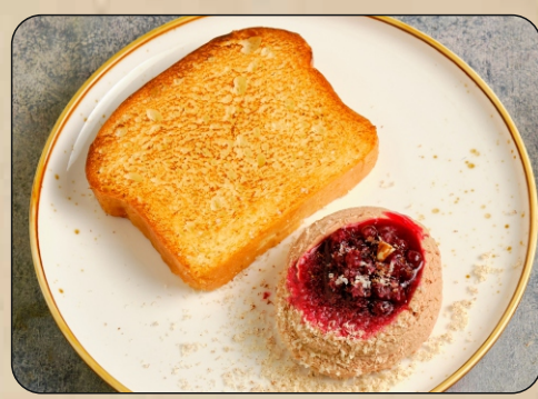
ПАШТЕТ ИЗ КУРИНОЙ ПЕЧЕНИ / CHICKEN LIVER PATE → 490 P