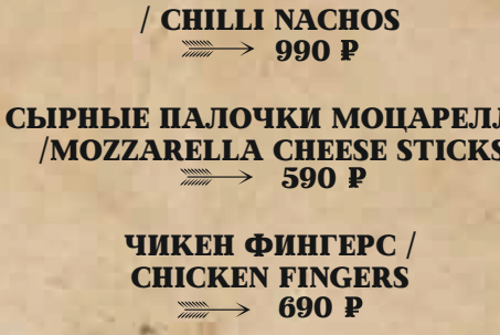
НАЧОС ЧИЛИ / CHILI NACHOS → 990 P