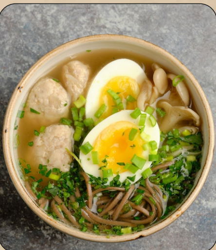
КУРИНЫЙ БУЛЬОН С ГРЕЧЕВОЙ ЛАПШОЙ И ФРИКАДЕЛЬКАМИ / CHICKEN BROTH WITH BUCKWHEAT NOODLES AND MEATBALLS → 510 P