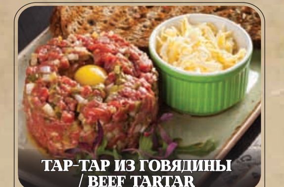
ТАР-ТАР ИЗ ГОВЯДИНЫ / BEEF TARTAR 690 P

ТЕПЛЫЙ САЛАТ С ЯЗЫКОМ И ОВОЩАМИ ГРИЛЬ / WARM SALAD WITH BEEF TONGUE AND GRILLED VEGETABLES ⇒ 620 P