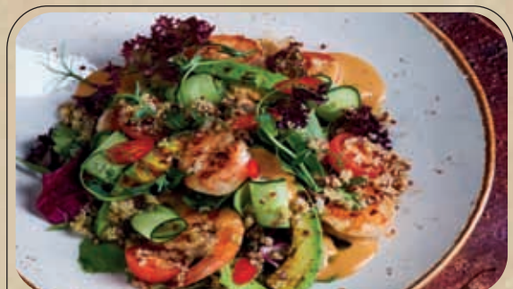
САЛАТ С ТИГРОВЫМИ КРЕВЕТКАМИ И АВОКАДО ГРИЛЬ / SALAD WITH TIGER PRAWNS AND AVOCADO 620 P

ЦЕЗАРЬ С КУРИЦЕЙ / CEZAR SALAD CHICKEN / ЦЕЗАРЬ С КРЕВЕТКАМИ / CEZAR SALAD SHRIMPS ⇒ 490/590 P