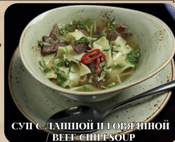
СУП С ЛАПШОЙ И ГОВЯДИНОЙ / BEEF CHILI SOUP