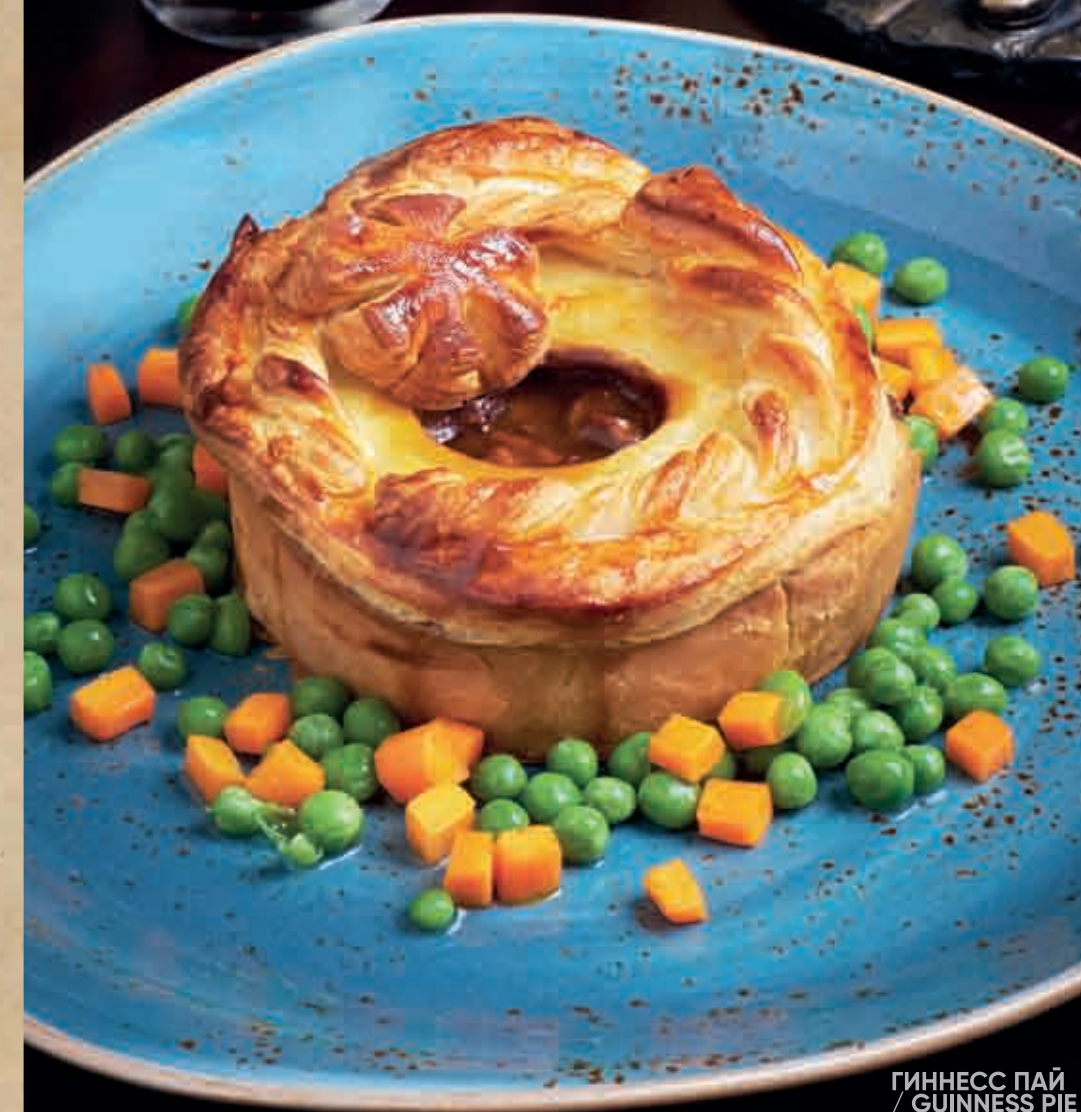
ГИННЕСС ПАЙ / GUINNESS PIE