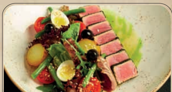
САЛАТ НИСЬЯЗ / NICOISE SALAD 590 P

Данная продукция является рекламным буклетом. Подробное меню Вы можете попросить у менеджера зала. Все цены указаны в рублях и включают НДС. К оплате принимаются только рубли и основные виды карт.